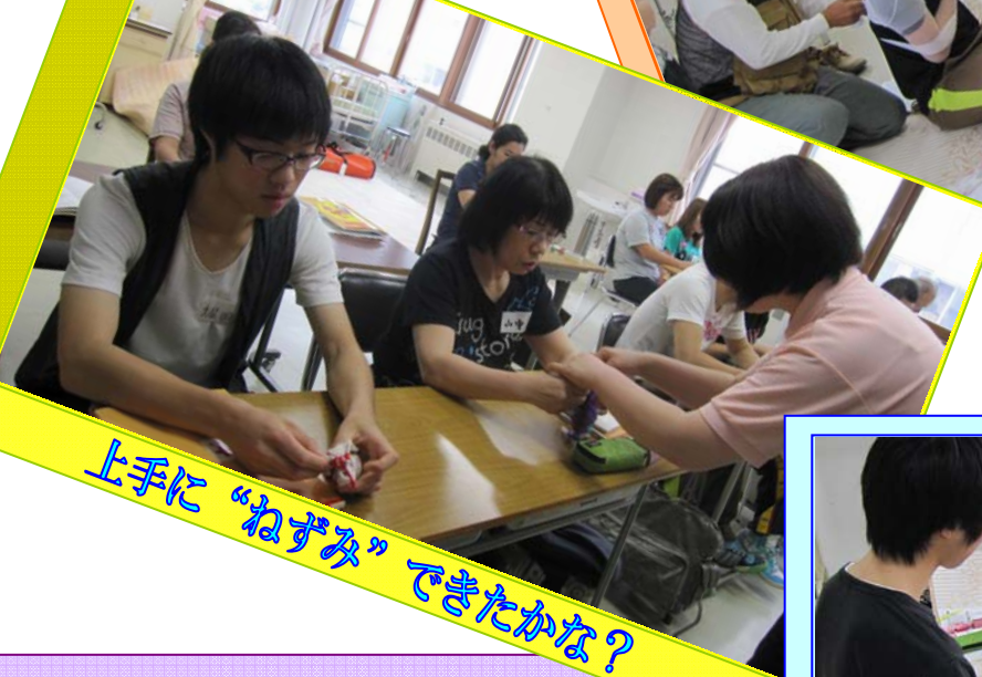
上手に“ねずみ” できたかな?