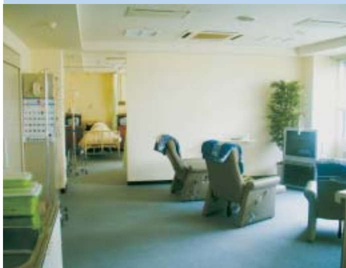
「外来化学療法センター」

健康保険証はご来院時に確認させていただいております。特に、更新・変更の際は必ずご提出ください。