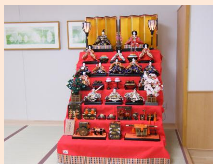
ひな祭り期間にはひな人形を飾っています