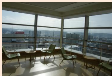
サンルームからの眺め

病棟は、木目調の壁や柔らかな色合いで、穏やかな雰囲気大切にしています。病棟からの見晴らしは良く、窓やテラスからは北見市街が一望でき、遠くの山々の景色が楽しめます。テラスへはベッドのままでも出られるようになっています。