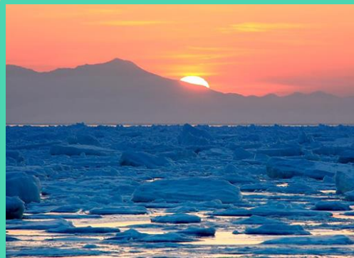
大自然 オホーツク海の流氷